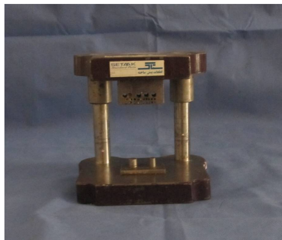
شکل ۱. مدل فلزی دو قسمتی

از جنس فولاد CK (نوعی فولاد ضد زنگ و مقاوم به سایش) و تقریباً مشابه با طرح صبوری [۳۴] استفاده شد. این وسیله از دو قسمت تشکیل شده است (شکل ۱). قسمت اول شامل یک صفحه فولادی با دو دای به شکل مخروط ناقص با مقطع گرد و شش درجه تقارب می‌باشد.