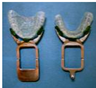
شکل ۱: نحوه اتصال ابزار تریسینگ خارج دهانی به استنت‌های آکریلی

رسام در حداقل ارتفاع به طوری که استنت آکریلی و چنگک‌های ابزار تریسینگ (clutch) و کامپوند متصل‌کننده آن‌ها در هیچ نقطه‌ای با یکدیگر تماس نداشته باشند، توسط کامپوند سبز ثابت گردید. سپس استنت‌های آکریلی در دهان جای داده شد و با قراردادن چندین رول پنبه در ناحیه دندان‌های خلفی دو طرف، به حدی که سوزن رسام با صفحه ترسیم اجازه تماس نداشته باشند، از بیمار خواسته شد که دندان‌ها را بر روی رول پنبه‌ها بفشارد تا Muscle deprogramming برای ۱۵ دقیقه انجام شود. سپس صندلی دندان‌پزشکی در وضعیت عمودی تنظیم گردید و رول پنبه‌ها از دهان بیمار خارج شد و از بیمار خواسته شد که حرکت طرفی به چپ و راست و حرکت به جلو و عقب را تا حداکثر میزان ممکن انجام دهد.